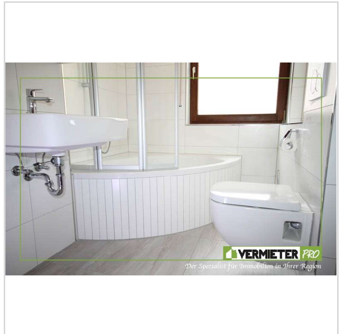
Tageslichtbad mit Wanne