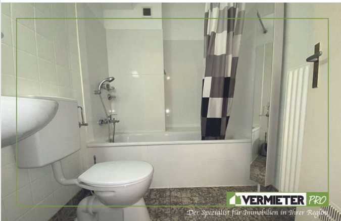
1.OG Badezimmer mit Wanne