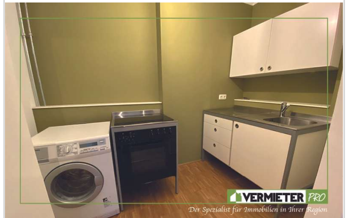
1. OG Kochnische